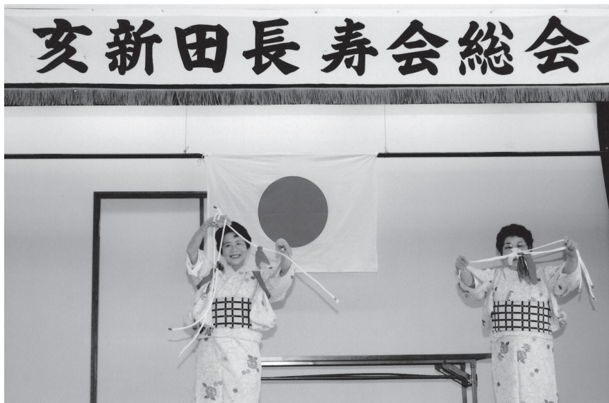
今後も夫婦そろって、元気に活動していきます！

マジック以外の活動として、佐布里の梅まつりのボランティア等もしています。今後も体が動く限り、老人クラブの活動とボランティア活動を通して、夫婦そろって元気に社会貢献活動をしていきたいと思っています。