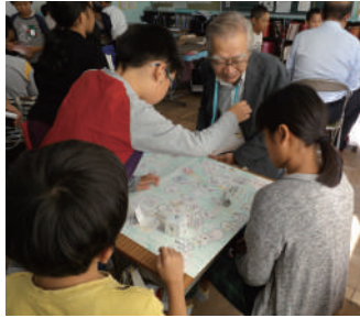
児童と楽しく交流

り、身も心も豊かになった子ども達に、どこまで伝えられたか気になる所です。これからの子どもたち、また高齢者の自身のためにも、自分の命は自分で守るとともに、地域の人達のかかわりを大切に、やさしさ、思いやりを持って歩んでほしいと思いました。