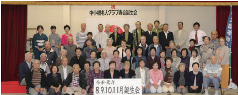
次回も元気で集まりましょう

中小根第1・2・3寿会の誕生会を開催しました。 今回はゲストとして、郷土・知多市の民俗芸能を守る会に来ていただき、尾張万歳を披露していただきました。 尾張万歳は、現在の名古屋市東区にある長母寺を開いた無住国師が寺の雑役をしていた村人に法華経を分かりやすく、節