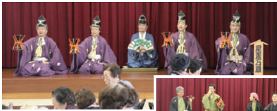
尾張万歳に みなさん夢中！