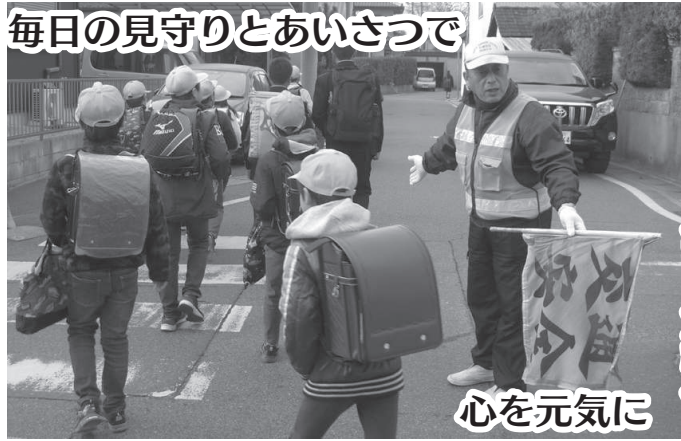
毎日の見守りとあいさつで