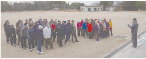
初心者大歓迎！ 次回は一緒にプレーしましょう♪

楽しい企画で 組織の活性化へ 粕谷台グランド同好会は現在、会員数84名、練習は、毎週火・金曜日午前中に大知山（知多高跡地）で60名前後の参加者で実施しています。「明るく、楽しく、元気良く」をモットーに、技術と言うよりも体力向上と親睦をメインに活動しています。中でも話題豊富なメシバーとの会話が毎回の楽しみの一つになっています。 毎週の活動以外に年間行事として、暑気払い大会、郊外での大会、期末大会を実施し、その後の