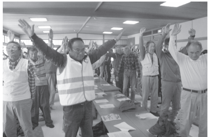
まずは準備運動から！

10月から11月にかけて10校区で歩け歩け運動を実施いたしました。それぞれの校区で1時間から2時間ほどウォーキング。参加者同士おしゃべりしながら足をしっかりと動かしました。今回の歩け歩け運動では全校区あわせて2,234名が参加しました。次回のウォーキングもみなさんの参加をお待ちしております。