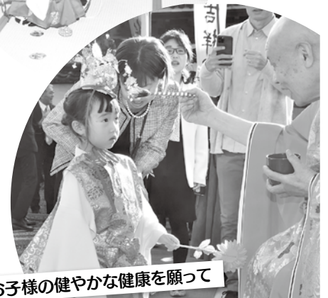
お子様の健やかな健康を願って