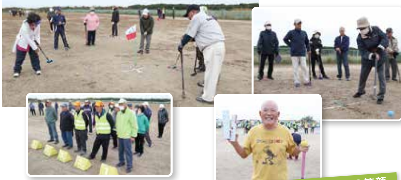
11月でもこの服装、この笑顔。元気がいちばん!