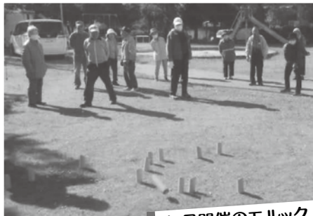
毎月開催のモルック

つつじが丘長寿会第2では友愛活動として毎月第2火曜日にランチ会をしています。友愛訪問の対象者の多くが自分で車を運転できないため、外食の機会が少なくなっています。外出の機会の確保と定期的に楽しみを持つよう月1回のランチ会(外食)をしています。