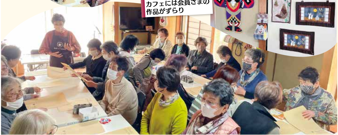
カフェには会員さまの作品がずらり

以上、「みえっこcafe」の活動を聞いて、自分たちの活動で活かすことはできないか、質疑応答に入り活発な意見交換が行われました。