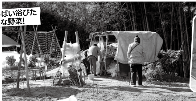
太陽をいっぱい浴びた おいしそうな野菜!